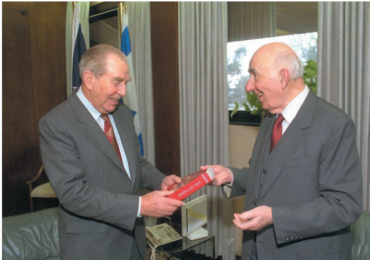
שופט בית המשפט העליון בדנימוס, חיים כהן, מגיש את ספרו "המשפט" לנשיא חיים הרצוג, צילום: סער יעקב (1992)

אפיקורוס. אכן, אף חיים כהן ראה בעצמו אפיקורוס 14 . הוא לא ראה בכך גנאי. אך בחוגים דתיים יהודי כזה נחשב גרוע מיהודי שנולד וגדל בחיק החילוניות, ולא זכה מימיו בחסד האמונה ובהכרת המצוות. אולם חיים כהן, אף שנעשה כופר בדת, לא נעשה כופר ביהדות. אדרבה, הוא נשאר נאמן ליהדות ככל שמדובר במורשת, בתרבות, בזהות. היהדות, גם אם פורקים ממנה את הדת, עדיין היא עגלה עמוסה. חיים כהן הכיר יהדות זאת מקרוב ומבפנים. לכן הוא לא היה מוכן לוותר על העושר הטמון ביהדות. להפך, נראה כי הפרדה מן האמונה הדתית חיזקה בו את הקשר למורשת היהדות. הוא לא הפסיק אף פעם, עד סוף ימיו, ללמוד ולשנות במקורות יהודיים. הידע העצום שלו בתורה ובפוסקים, ההערצה שלו לחכמי ישראל והרצון לעסוק בהם אף הלכו וגברו. המורשת היהודית הייתה בעיניו, לא רק עשירה בנכסי רוח שנצברו במשך דורות רבים, אלא גם יפה, מלאה חוכמה, שופעת ערכים של כבוד האדם, הגינות וחמלה. לא פחות חשוב, היא רלוונטית גם כיום. אפשר להיות גאים באוצר כזה. טעות ואף שטות היא להתעלם מהאוצר. המורשת היהודית, והספרות הדתית כעמוד תווך